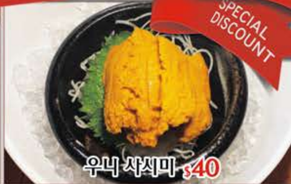
우니 사시미 $40