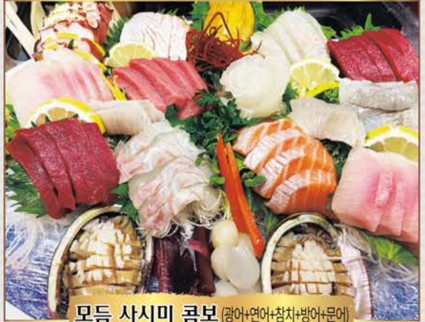
모듬 사시미 콤보 (광어+연어+참치+방어+문어)