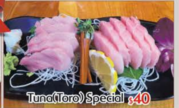
Tuna(Toro) Special $40