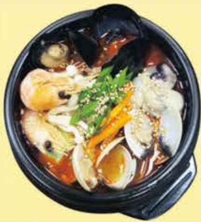
순두부 Soft Tofu Stew