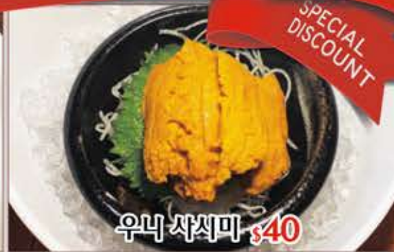
우니 사시미 $40