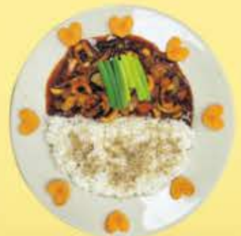
컵밥(오징어, 불고기, 치킨, 김치)

김치, 깍두기, 나박김치 맛은 어디서도 비교할 수 없는 맛을 자부합니다. *