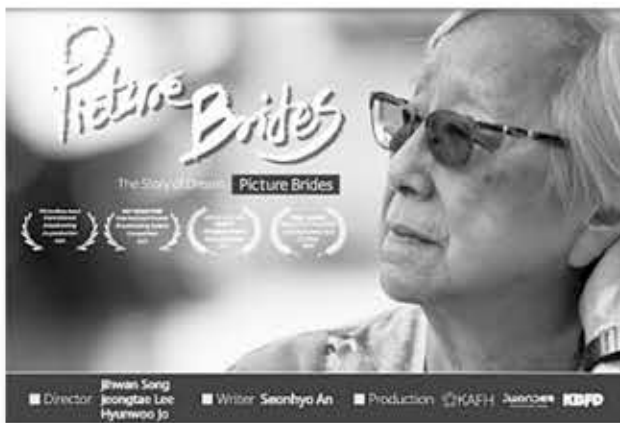
▲ 휴스턴국제영화제에서 은상을 수상한 '사진 신부'.

1세대 한인 이민자들의 삶을 다룬 다큐멘터리가 휴스턴국제영화제에서 은상을 받았다.