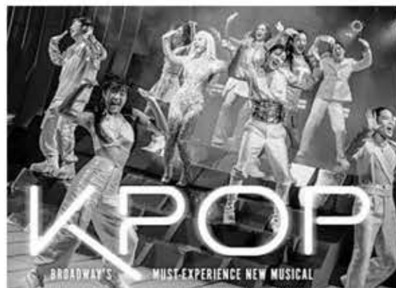
▲ 한국 뮤지컬 'KPOP'.

이 작품은 지난해 11월 무대에 올렸지만 흥행 성적이 저조하고 언론과 비평의 큰 호응도 받지 못해 2주 만에 막을 내렸다. 하지만 2017년 오프브로드웨이 소극장에서 전석 매진 행렬을 기록했다.