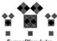
Forms of Knowledge