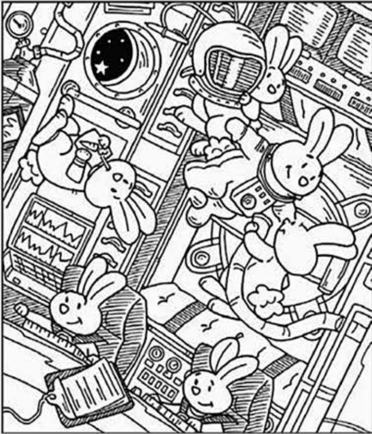
© 위의 그림에 숨어있는 아래 그림을 찾으며 영어 단어도 익혀 보세요. (해답은 P53에 있습니다.)