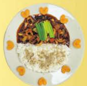
컵밥(오징어, 불고기, 치킨, 김치)

김치, 깍두기, 나박김치 맛은 어디서도 비교할 수 없는 맛을 자부합니다. *