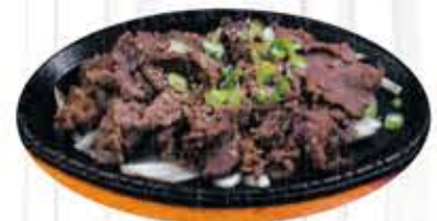
불고기 $23.99 K-BBQ Beef