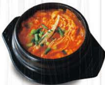
김치찌개 $13.99 Kimchi Stew