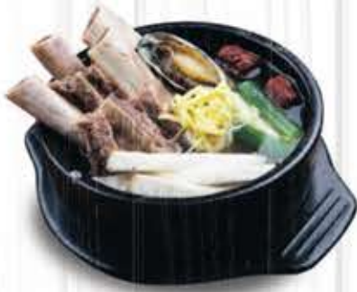
갈비탕 $15.99 Galbi Stew

갈비로 우려낸 국물과 멸치, 새우, 다시마등으로 만든 채수 국물로 정성껏 순두부 식사를 준비합니다. *천연 순두부를 사용합니다.