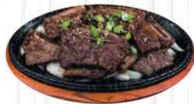
갈비구이 $25.99 K-Galbi