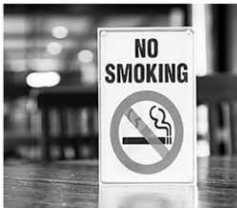
▲ 부에나파크 시가 금연 조례안을 제정했다.

통과된 조례안에는 아파트 등 다세대 주택 실내외와 인접한 인도, 공공 건물 인근, 쇼핑 센터와 주차장, 파머스 마켓, 야외 공사장 등이 금연 지역에 새로 포함됐다. 다만 다세대 주택 실내 흡연 금지 조항에서 의료용 마