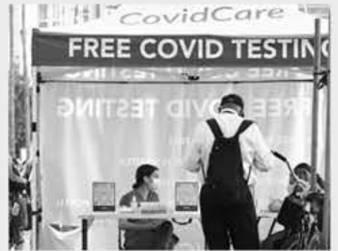
▲ 비상사태가 해제됨에 따라 카운티 정부가 운영하는 코로나19 검사소도 문을 닫았다.

LA카운티가 지난달 31일 자정을 기해 코로나19 비상 사태 종료를 선언했다.