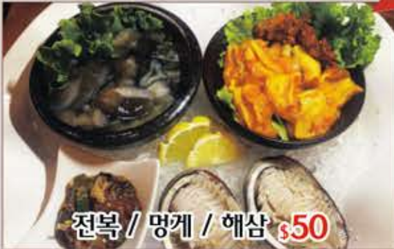
전복 / 멍게 / 해삼 $50