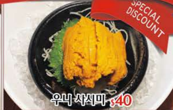
우니 사시미 $40