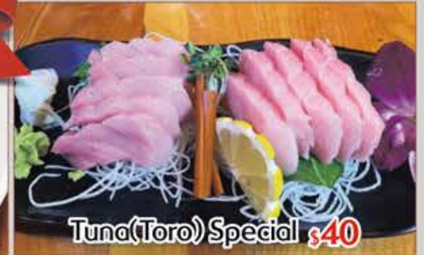
Tuna(Toro) Special $40