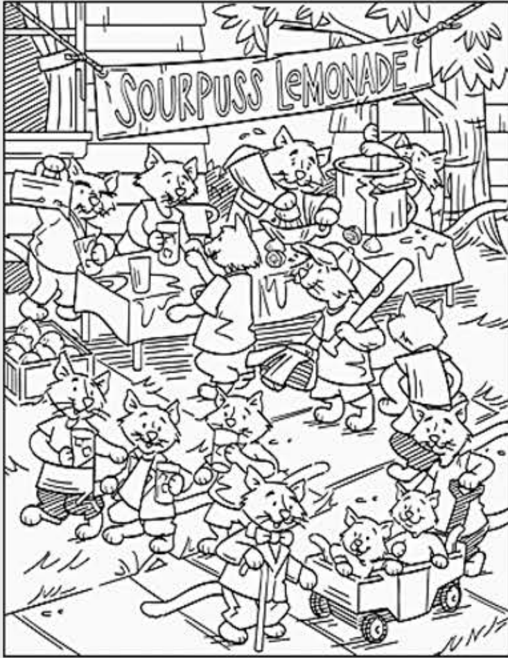
○ 위의 그림에 숨어있는 아래 보기와 같은 각기 다른 형태의 Pitcher 12 개와 숨겨져 있는 4개의 Pitcher를 찾아보세요. (해답은 P56에 있습니다.)