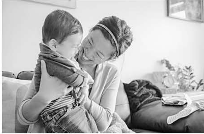
▲ Anthem Blue Cross가 한인들을 위해 한국어 진료 서비스를 제공한다.

Anthem Blue Cross 개인 플랜사업부 부사장 겸 총괄 관리자인 Manan Shah는 “저희 추정으로는 Anthem 개인 회원 10명 중 9명이 재정 지원을 통해