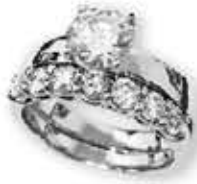
▲ 모이사나이트 5캐럿 반지

특별 프로모션 크리스마스 공짜 선물에는 200달러 이상 구매 시 칼라스톤 팔찌를 증정하며, 500달러 이상 구매 시 왕실 전용 산삼 소백라삼, 1,000 달러 또는 2,000 달러 이상 구매 시 기능성 기적의 화장품 세트를 공짜 선물로 준비했다.