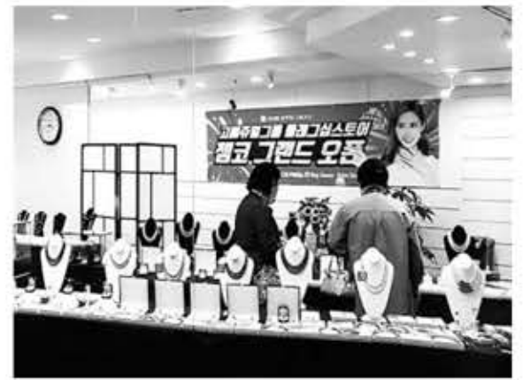
▲ 엘에이 줌코 행사장 모습