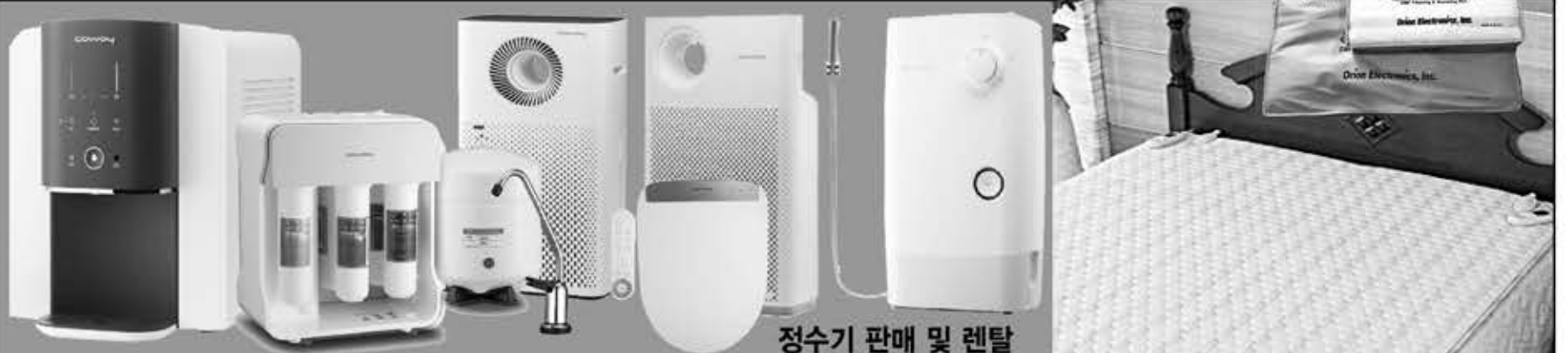
정수기 판매 및 렌탈

714.523.9588 / 714.471.1843 5301 Beach Blvd, Buena Park, CA 90621 한남체인 내