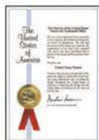
US patent Cert, syringe stopper

University of California, Berkeley USC School of Medicine UCLA-affiliated hospital 내과 전문의 과정 노인 내과 전문의 재생의학 전문의 한국 화이자 제약회사 의학부 부장 한국 의료법 학회 이사 한국 의사 면허 중국 베이징 의사 면허