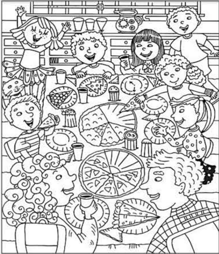
© 위의 그림에 숨어있는 아래 그림을 찾으며 영어 단어도 익혀 보세요. (해답은 P50에 있습니다.)