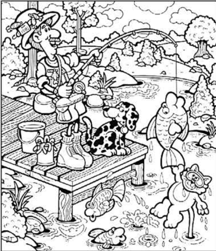
© 위의 그림에 숨어있는 아래 그림을 찾으며 영어 단어도 익혀 보세요. (해답은 P47에 있습니다.)