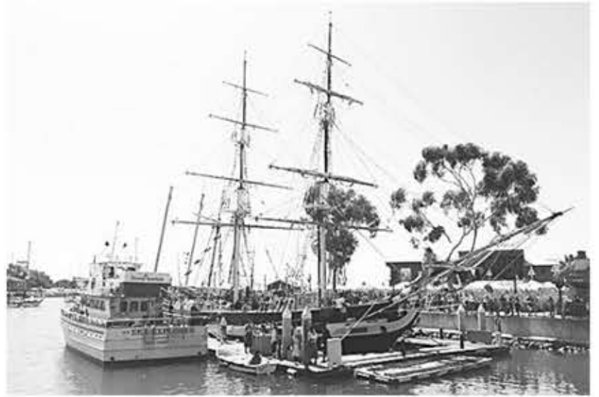
▲ 다나 커브 파크

주말에 바닷바람이 최고 싶을 때 가족들과 다녀오기 좋은 곳이다. 적당히 걸으며 다른 바닷가에서 경험해 보지 못했던 것들을 즐길 수 있다.