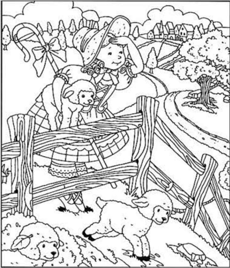
◎ 위의 그림에 숨어있는 아래 그림을 찾으며 영어 단어도 익혀 보세요. (해답은 P46에 있습니다.)