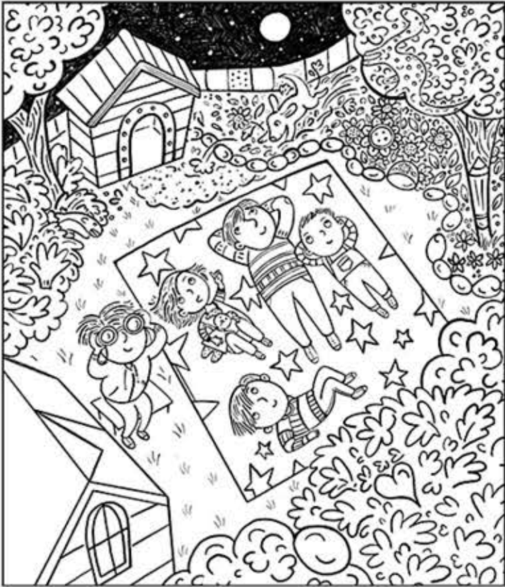
© 위의 그림에 숨어있는 아래 그림을 찾으려 영어 단어도 익혀 보세요. (해답은 P46에 있습니다.)