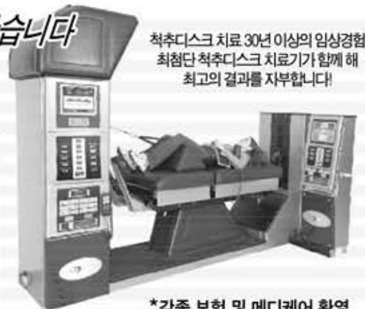
*각종 보험 및 메디케어 환영

척추디스크 치료 30년 이상의 임상경험 최첨단 척추디스크 치료기가 함께 해 최고의 결과를 자부합니다!