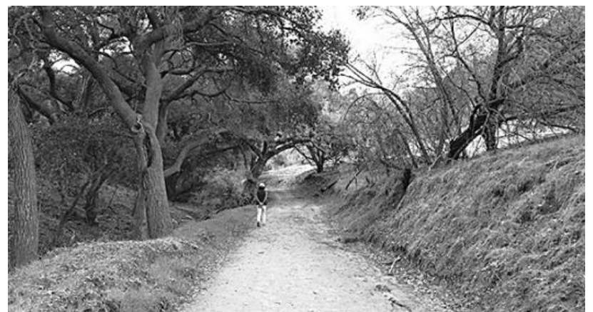
▲ Powder Canyon Trail.

오렌지카운티에서는 Harbor Blvd.를 타고 북상하다가 Pathfinder Rd.에서 우턴해서 조금 올라가 Fullerton Rd.를 만나 우회전하면 된다.