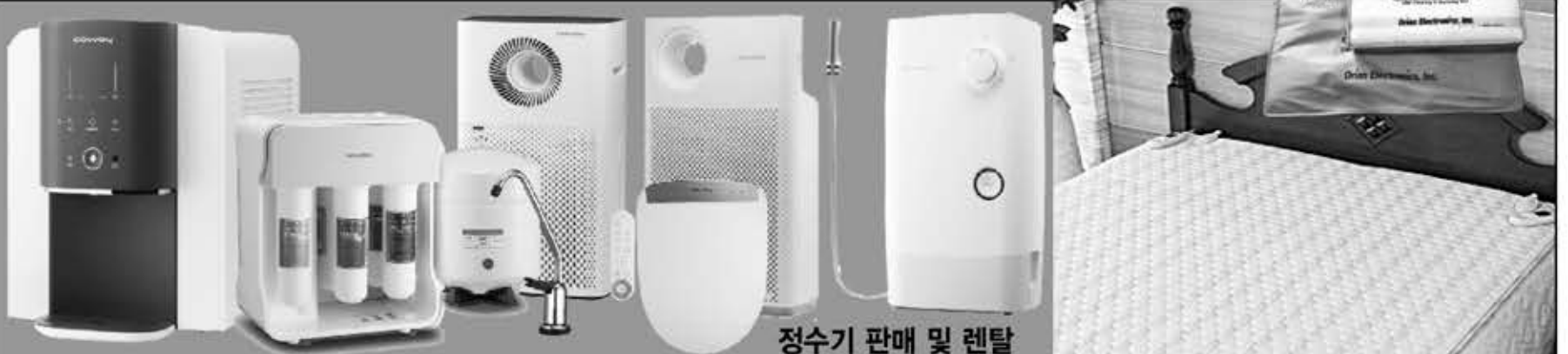
정수기 판매 및 렌탈

714.523.9588 / 714.471.1843 5301 Beach Blvd, Buena Park, CA 90621 한남체인 내