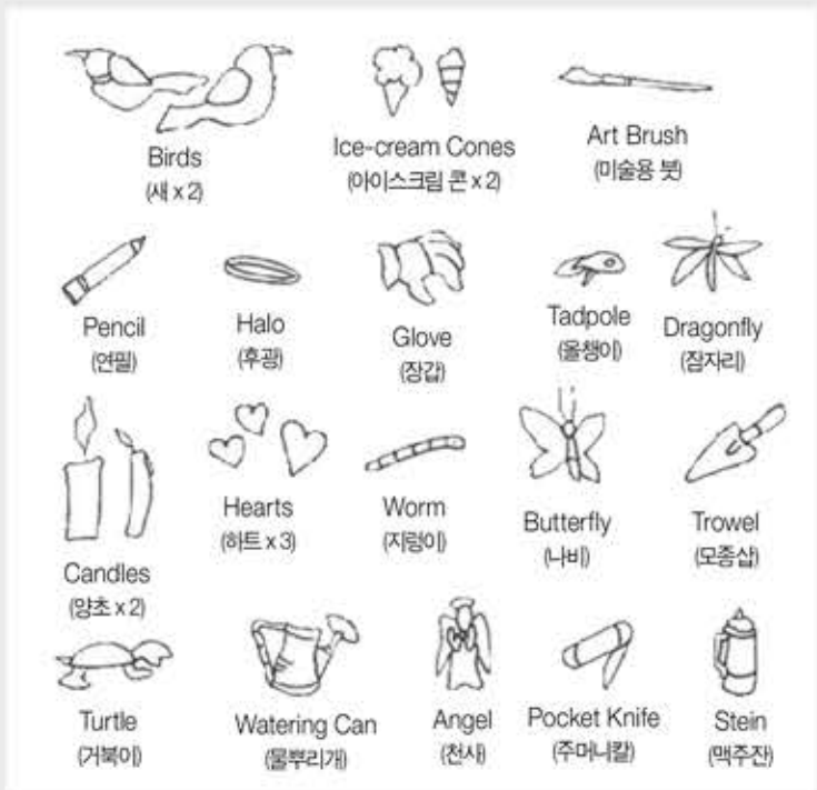
■ 이미지 출처: www.pinterest.com