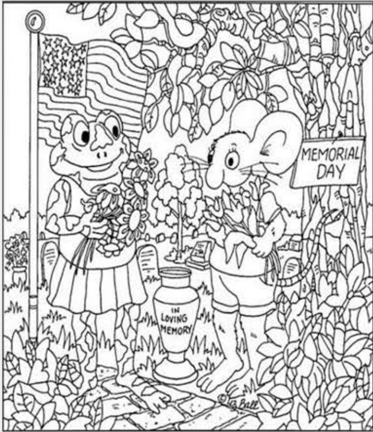
◎ 위의 그림에 숨어있는 아래 그림을 찾으며 영어 단어도 익혀 보세요. (해답은 P50에 있습니다.)