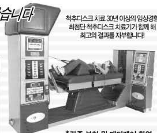
*각종 보험 및 메디케어 환영

척추디스크 치료 30년 이상의 임상경험 최첨단 척추디스크 치료기가 함께 해 최고의 결과를 자부합니다!