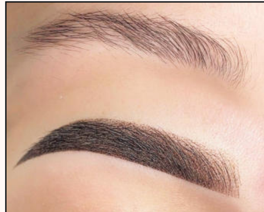
▲ EPPO에서 눈썹 시술 받은 고객의 실제 전후 비교 사진