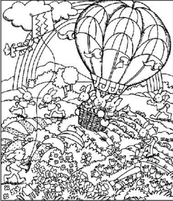
◎ 위의 그림에 숨어있는 아래 그림을 찾으며 영어 단어도 익혀 보세요. (해답은 P46에 있습니다.)