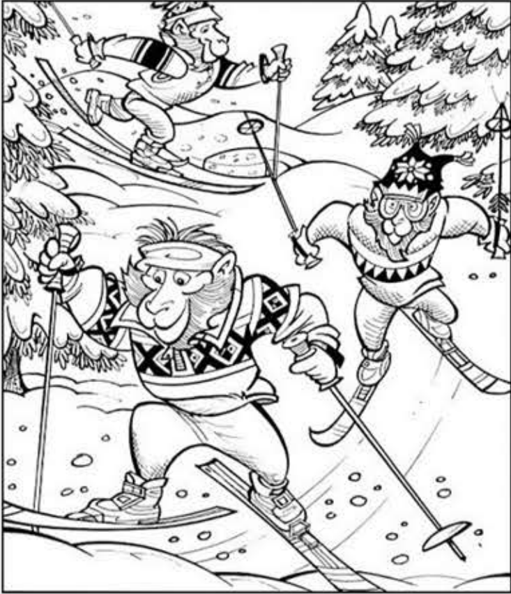
© 위의 그림에 숨어있는 아래 그림을 찾으며 영어 단어도 익혀 보세요. (해답은 P46에 있습니다.)