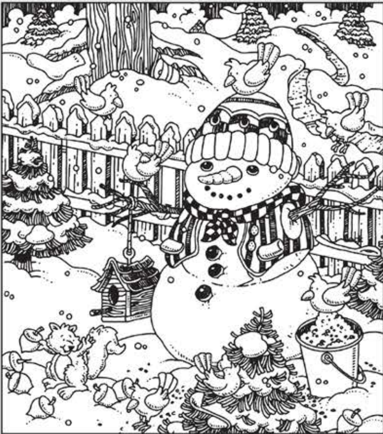
© 위의 그림에 숨어있는 아래 그림을 찾으려 영어 단어도 익혀 보세요. (해답은 P46에 있습니다.)