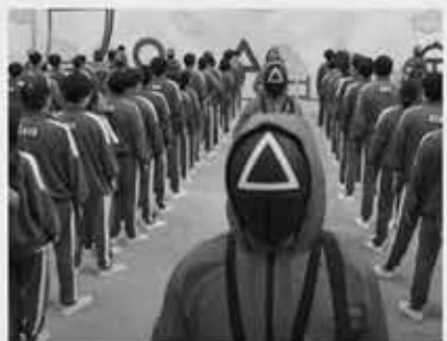
▲ 넷플릭스 오징어 게임의 한 장면

그룹 방탄소년단(BTS), 영화 기생충, 드라마 오징어 게임과 같은 한국 문화에 대한 관심으로 영국 대학에서 한국어 전공하는 학생이 늘어났다는 분석이 나왔다.