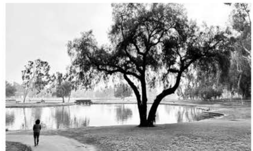
▲ 트라이시티 공원