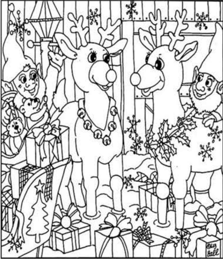
© 위의 그림에 숨어있는 아래 그림을 찾으며 영어 단어도 익혀 보세요. (해답은 P50에 있습니다.)