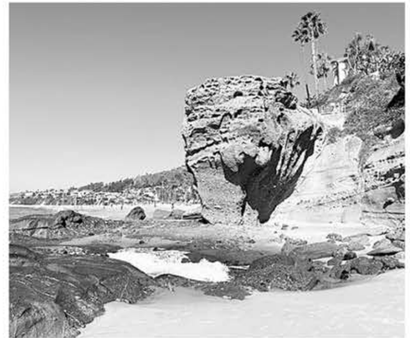
▲ 알리소 비치.