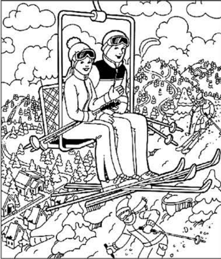
© 위의 그림에 숨어있는 아래 그림을 찾으려 영어 단어도 익혀 보세요. (해답은 P50에 있습니다.)