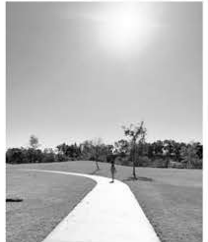
을 따라 끝까지 갔다 오면 40분에서 50분 정도 소요된다.

Mason Regional Park은 어바인의 공원치고는 그리 큰 편은 아니나, 9.2 에이커에 달하는 호수와 피크닉 쉼터와 어린이들이 놀 수 있는 놀이터가 군데군데 만들어져 있어 어린이를 동반한 가족 단위의 방문객이 많이 찾는 곳이다. 한국의 공원처럼 체력 단련을 위해 개인이 이용할 수 있는 각종 운동시설이 갖춰 있으나 그늘이 없는 곳에 있어 한낮에는 이용하기 불편하다. 1973년 처음 오픈할 때는 45에이커였으나 1978년 9.2에이커의 호수를 만들면서 50에이커(200,000m 2 )로 확장했다. 아름다운 호수는 가로 약 900ft(270m), 세로 800ft(240m)로 공원 한가운데 자리 잡고 있다. 전 어바인 컴퍼니의 회장이었던 윌리엄 메이슨의 이름을 공원 이름으로 명명했다. 오렌지카운티의 다른 공원들과 마찬가지로 주차비를 받고 있으니 유의하기 바란다.