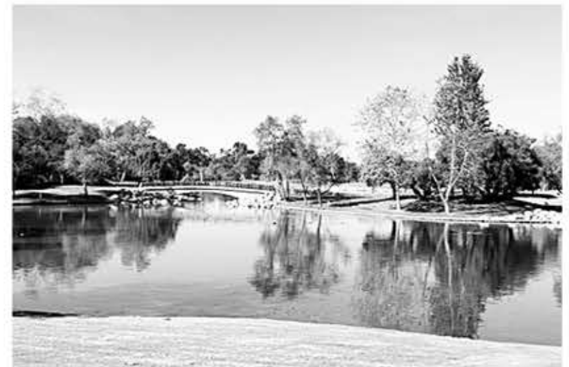
▲ 메이슨 레저널 파크

공원 입구에서 주차비를 내고 들어서면 양 갈래 길이 나온다. 좌회전해서 쪽 가면 Culver Dr.로 진입하게 된다. 그곳에서 좌회전하면 파킹랏 F이다. 여기 차를 주차하고 가장자리 길