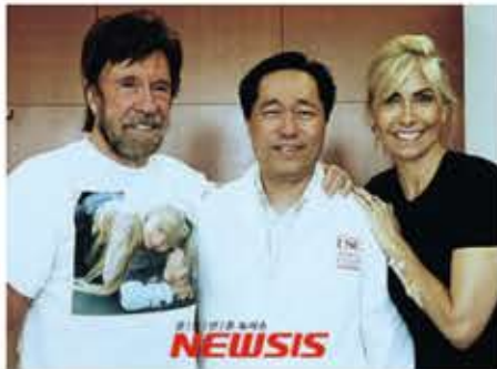
뉴스시 2016. 12. 28 - 뉴스시 기사 중