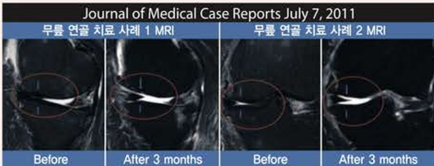
*SVF 자가 지방줄기세포 + PRP 연골재생 관련 다수 연구 및 논문 발표