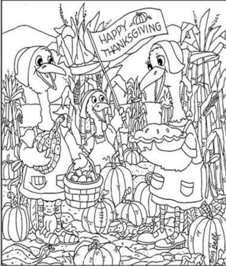
© 위의 그림에 숨어있는 아래 그림을 찾으며 영어 단어도 익혀 보세요. (해답은 P50에 있습니다.)