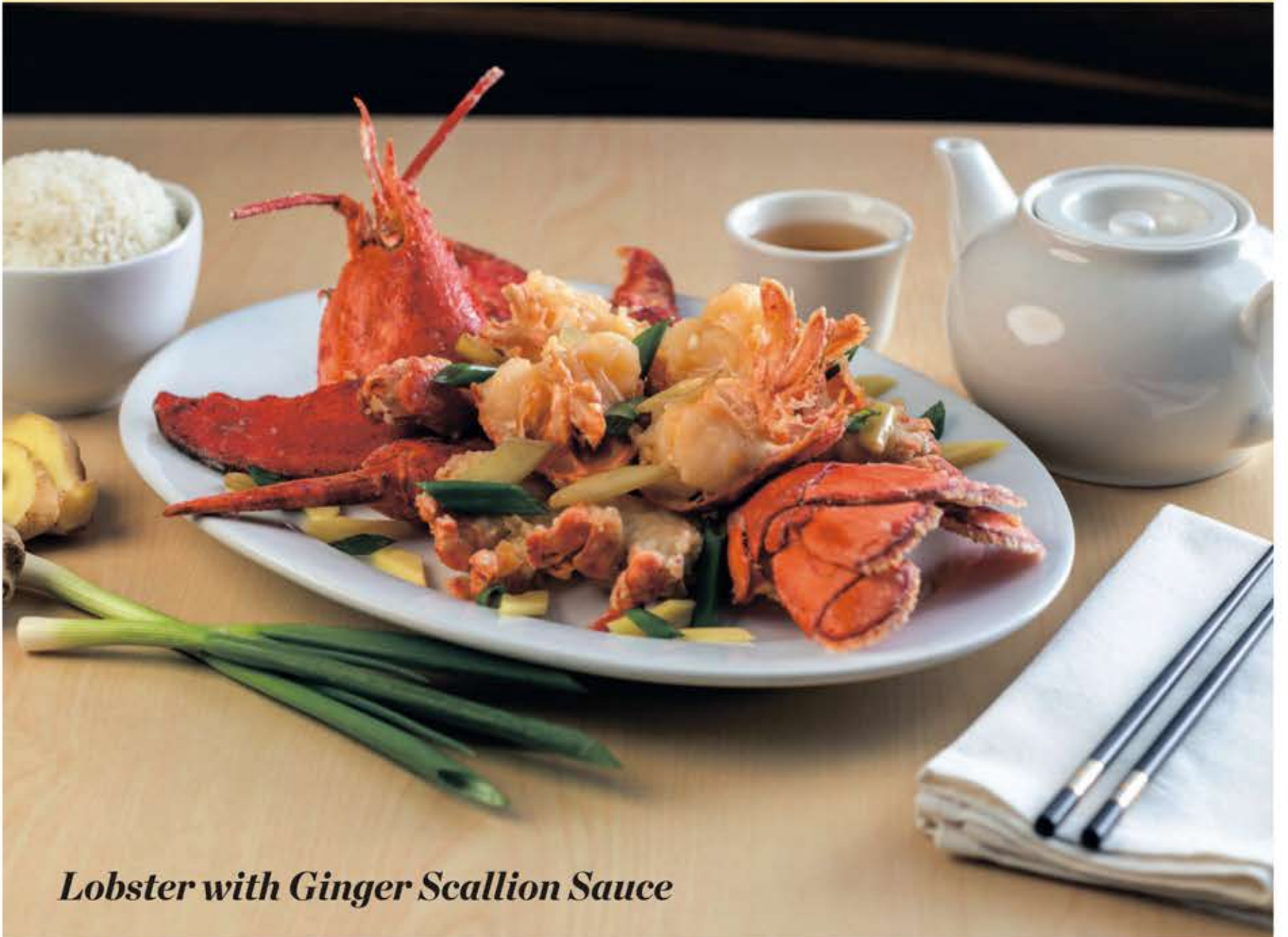
Lobster with Ginger Scallion Sauce