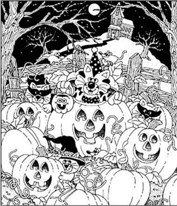
◎ 위의 그림에 숨어있는 아래 그림을 찾으며 영어 단어도 익혀 보세요. (해답은 P46에 있습니다.)