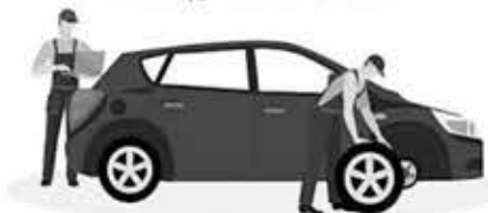
자갈의 파편 등으로 충격이 전해질 수 있기 때문에 차체 하부의 손상이나 타이어의 마모도와 이물질들을 함께 체크해주세요!

휴가철에 산이나 계곡을 다녀왔다면 자갈 파편을 주의해야 한다. 자갈의 파편 등으로 차량에 충격이