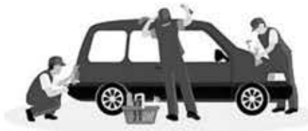
바닷물에 있는 소금기는 차 도장면을 부식 변색시키며 차체에 붙은 모래나 먼지가 흠집을 낼 수 있기 때문에 부드러운 천으로 닦아낸 후 세차를 해주세요!

해안도로나 바닷가 근처를 다녀왔다면 바닷가 염분에 유의해야 한다. 바닷물에 있는 소금기가 자동차 도장면을 부식 변색시키기 때문이다. 차체에 붙은 모래나 먼지가 자동차에 흠집을 낼 수 있기 때문에 부드러운 천으로 닦아내는 것이 우선이다. 그 뒤 전체적으로 세차를 해준다.