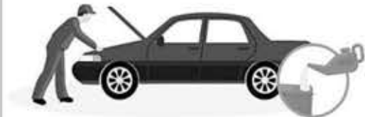
더운 여름 이후 고온에서 노출된 차량의 오일류나 냉각수가 부족하지 않은지 점검이 필요합니다

역대 최고의 폭염을 기록한 올여름, 고온의 상태에 노출된 차량의 오일류나 냉각수에 기포가 생겨 양이 줄거나 묽어지지 않았는지 반드시 점검이 필요하다.