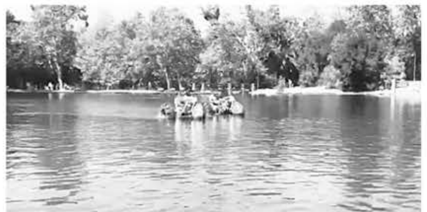
▲ 어바인 리저널 파크, 사진=타운뉴스