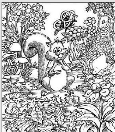
○ 위의 그림에 숨어있는 아래 그림을 찾으며 영어 단어도 익혀 보세요. (해답은 P8에 있습니다.)