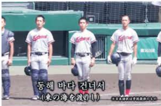
▲ 일본 전국 고교 야구선수권대회 준준결승 승리 후 교토 국제고의 한국어 교가가 올려 퍼지고 있다.

8월, 일본 효고현에서는 '전국 고등학교 야구선수권대회'가 열린다. 이 대회는 일명 '고시엔'으로 더 잘 알려져 있다. '고시엔'이라는 이름은 본선 경기가 열리는 효고현 니시미야시 소재 프로야구 한신 타이거스의 홈구장인 '한신 고시엔구장'에서 따왔다.