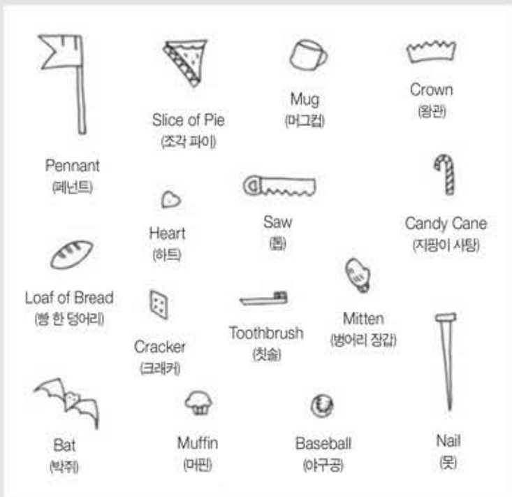
■ 이미지 출처: pinterest.com