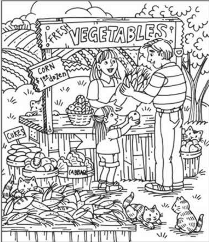
© 위의 그림에 숨어있는 아래 그림을 찾으며 영어 단어도 익혀 보세요. (해답은 P46에 있습니다.)