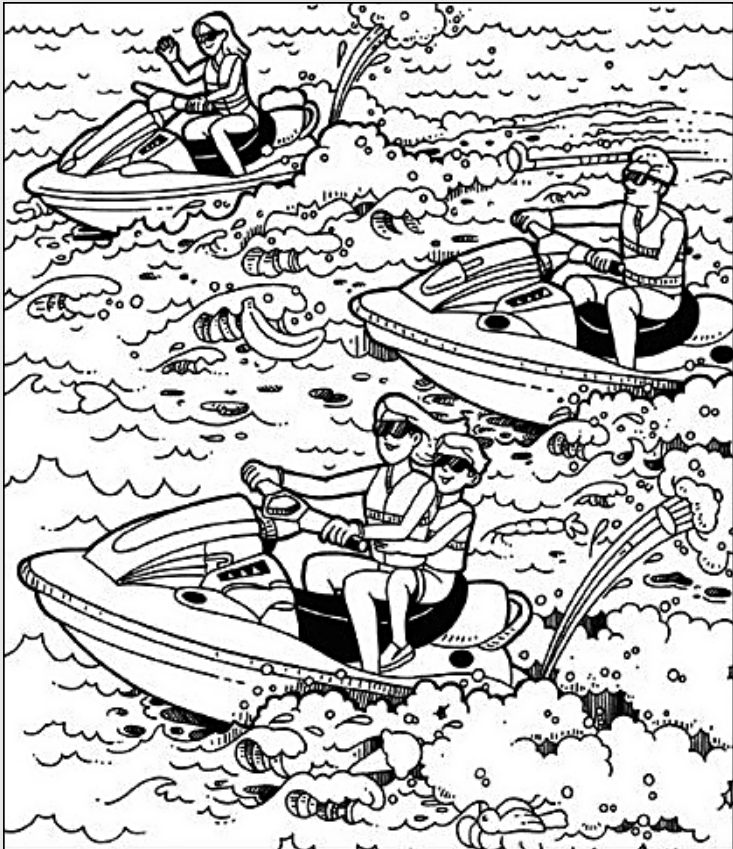
© 위의 그림에 숨어있는 아래 그림을 찾으며 영어 단어도 익혀 보세요. (해답은 P46에 있습니다.)