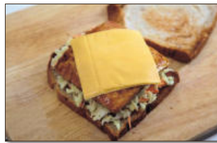
6. 5 위에 간장소스로 잘 조리된 두부를 올리고, 체다슬라이스치즈를 올려서 나머지 빵으로 덮어주면 끝.