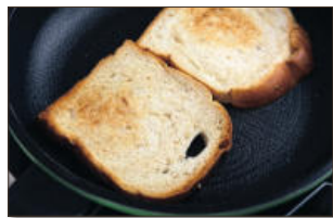
2. 식빵은 아무것도 두르지 않은 팬에 앞뒤로 노릇하게 구워 습기가 차지 않도록 세워서 놓는다.