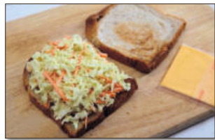
5. 구운 식빵에 양배추 샐러드를 돌로 나눠 듬뿍 올린다.