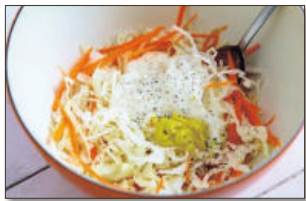
4. 채 썬 양배추와 당근은 볼에 담고, 양배추양념재료인 마요네즈, 머스터드, 소금, 후춧가루를 넣고 골고루 잘 섞는다.