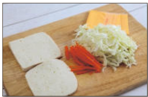
1. 두부는 두부 모양 그대로 약 1cm 두께로 썰고, 양배추, 당근은 채 썰고, 체다슬라이스 치즈도 함께 준비한다.