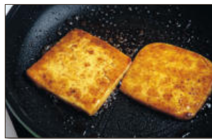
3. 팬을 다시 달걀식용유를 살짝 두르고 두부를 올려 앞뒤로 노릇하게 부친 후 두부조림장재료를 넣고 물기 없이 바짝 조리준다.