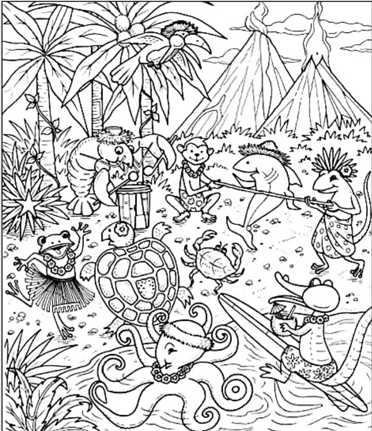
© 위의 그림에 숨어있는 아래 그림을 찾으며 영어 단어도 익혀 보세요. (해답은 P46에 있습니다.)