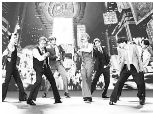
▲ 지난해 MTV 비디오 뮤직 어워즈에서 '다이내마이트' 공연하는 방탄소년단.

'베스트 팝', '베스트 K팝', '베스트 안무', '베스트 편집' 부문에는 올해 5월 발표한 '버터'가 후보에 들었