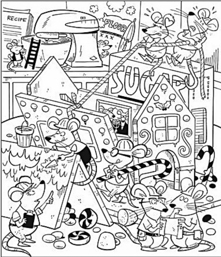
© 위의 그림에 숨어있는 아래 그림을 찾으며 영어 단어도 익혀 보세요. (해답은 P46에 있습니다.)