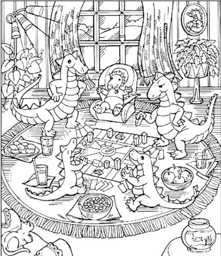
© 위의 그림에 숨어있는 아래 그림을 찾으려 영어 단어도 익혀 보세요. (해답은 P50에 있습니다.)